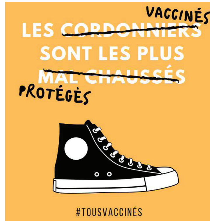
CAMPAGNE DE L'UNIVERSITÉ CLERMONT AUVERGNE