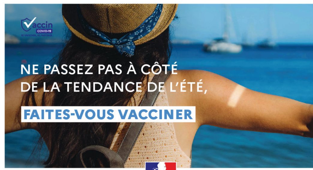
CAMPAGNE DU MINISTÈRE DE L'ENSEIGNEMENT SUPÉRIEUR, DE LA RECHERCHE ET DE L'INNOVATION