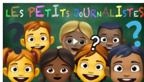
Les petits journalistes, « Les élections présidentielles », avril 2022